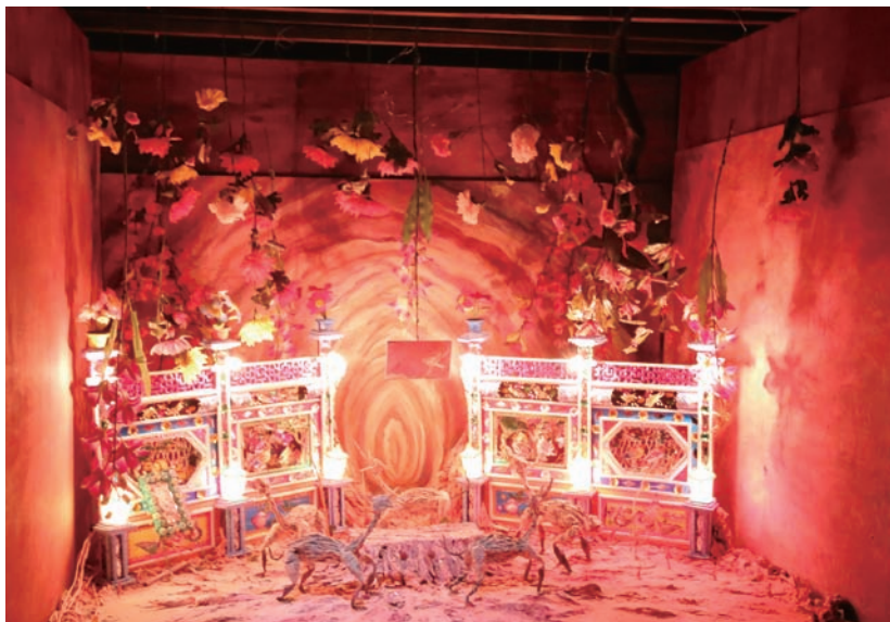
張徐展 「紙人展一房間」系列〈靈靈壹〉場景裝置 2014 報紙、漿糊、木板、鋁絲骨架