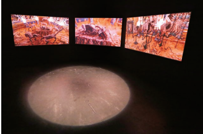
張徐展 「紙人展一房間」系列〈靈靈壹〉 2014 三頻道動畫錄像、空間裝置

在台北數位藝術中心，要進入展場前得先穿越一段狹長的走道，還沒轉進展間即會看到不斷旋轉的紙偶投影。黝暗的通道中，觀者只能看到一方昏黃的燈光襯著墨色的影子，那影子像是幽靈、亦是連結展場內外的隘口。在第一個展間內播放的是三頻道偶動畫「紙人展一房間」系列〈零零壹〉，場景結合臟器般的山洞與紙紮樓房常見的欄杆牌樓，形成一個未明而曖昧的場域。祭壇上躺著一隻病懨懨的狗兒，三隻不知名的生物不斷地繞著祭壇轉圈，狗兒時睡時醒；帶有儀式性的場景和配樂中吟唱的