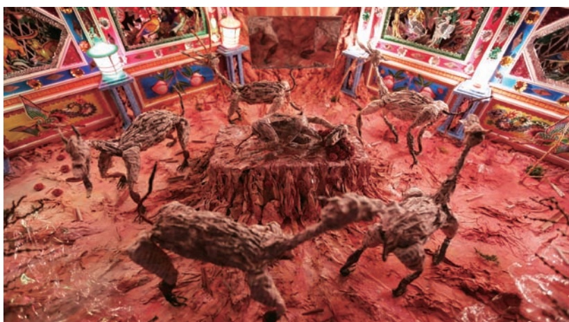
張徐展 「紙人展一房間」系列〈靈靈壹〉（影像截圖） 2014 三頻道動畫錄像