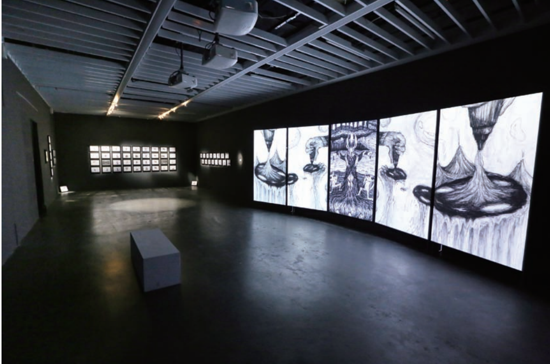
張徐展 陰極射線管的神秘儀式 2012-3 五頻道同步動畫錄像裝置