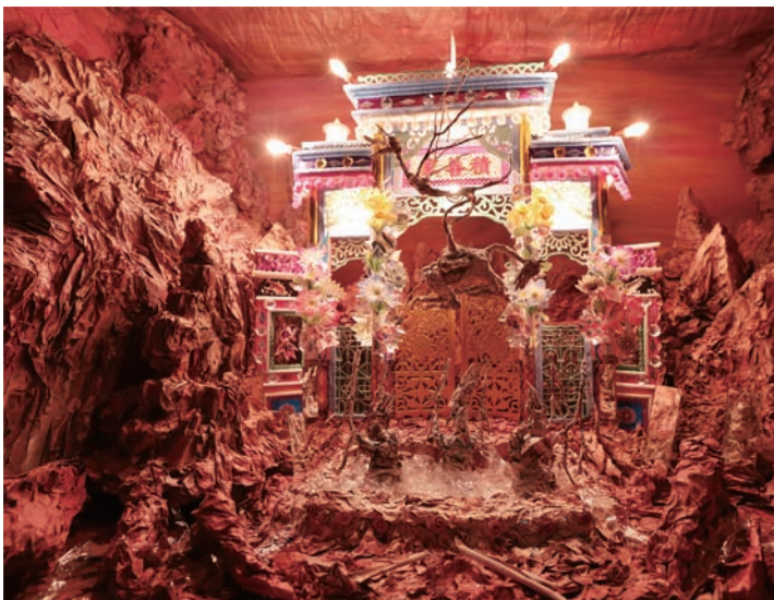
張徐展 「紙人展—自卑的蝙蝠」系列〈靈靈參〉(影像截圖) 2015 雙頻道正反反映

看張徐展的新作，會直接地被其手感十足的影像質地所吸引，而夾雜著殘敗、腐蝕與消亡的氣息，與生命的循環、產業的消逝有著平行的關聯。事實上，偶動畫中的狗，不只是張徐展家中曾飼養的老狗，同時也是新興糊紙店的化身。「自卑的蝙蝠」與「紙人展—房間」系列，其實另