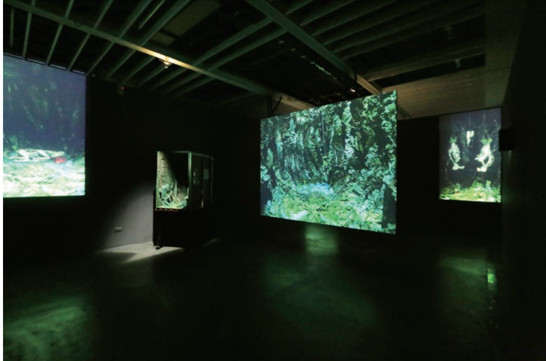
張徐展 「紙人展—自卑的蝙蝠」系列〈靈靈參〉 2014-5 雙面正反投影、四頻道直立動畫錄像