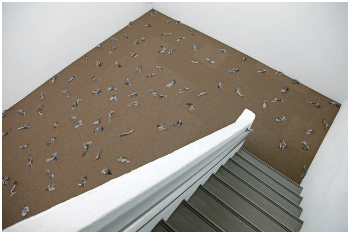
陳松志 無題—房間3 2016 地毯、棉線 610×420cm

的展場，以避免看展的觀眾過分放鬆，不小心弄亂或破壞了他精心設計好的「意外」——儘管展場看起來像是隨意安排的，但那是藝術家的精心布置，再怎麼散亂都經過計算，一條棉線的位置都動不得。