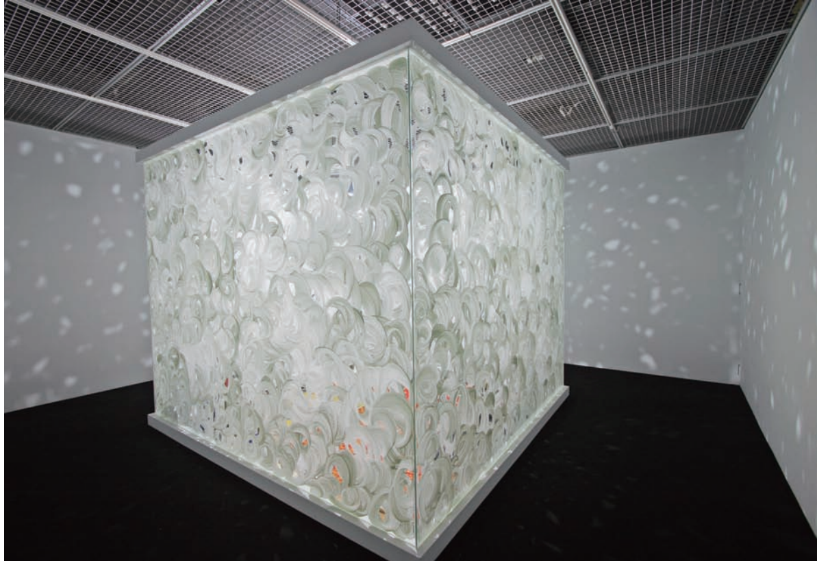
陳松志 無題一房間1 2008 拾得現成物、尿液、旋轉馬達 730×610×300cm