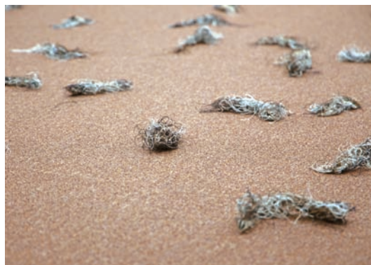
陳松志 無題—房間3 (局部)

從作於2003年的〈記憶·果園〉開始，陳松志就試著由周遭隨手可得的物件中，尋找能容納感性經驗的材質做為作品的主體。在〈記憶·果園〉中所使用的是烘烤或油炸至焦黑的蘋果，這件作品有兩個線索，一個是來自於陳松志成長中對於蘋果的記