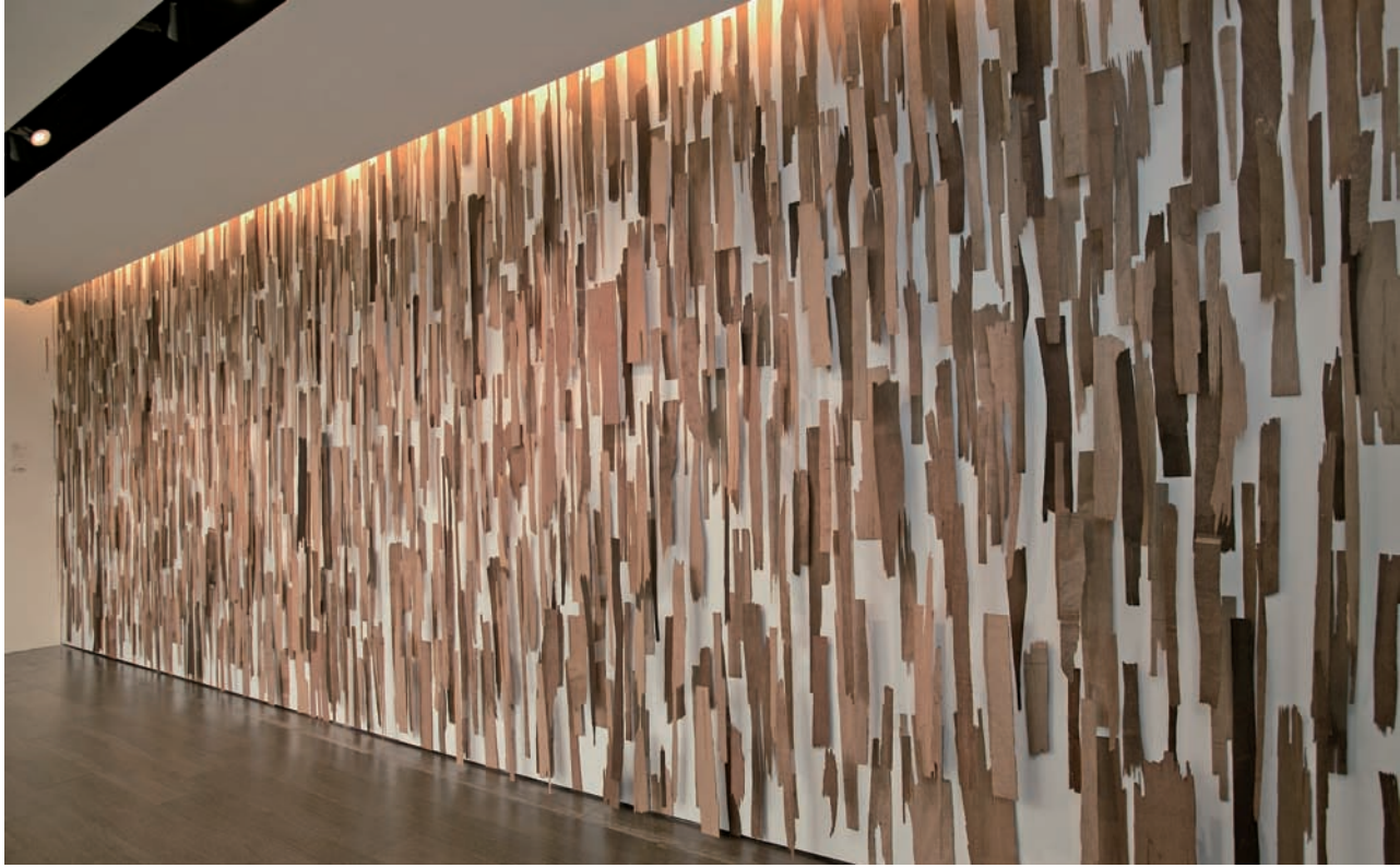
陳松志 微弱的美感 2012 木料 248×665cm 國立台灣美術館藏

的廣告雜誌紙，是來自於陳松志於紐約駐村時對消費現象的省思。「廣告雜誌紙這項東西，總讓我想到『昨是今非』這四個字。它的價值在短時間內是劇烈變動的，前一刻出印廠時還有資訊價值，但轉手之後可能就因為過期成為垃圾。」陳松志迷戀廣告紙可能承載的意涵，也儘可能地去實驗這項材質在創作上的可能性。在伊通公園的個展裡，他把廣告紙隨手揉成球狀，連同裝了水的塑膠袋塞進牆面，牆面上有些地方有著紙張擦過的痕跡，好像藝術家才剛剛抓著它們劃過去一般，而塑膠袋、袋子裡面的水以及廣告紙，這三樣物件被同時卡在一個洞裡面，似乎有什麼東西或者抽象不可見的意義同時被凍結了。陳松志說，在〈無題2016〉這件作品中他想探索兩件事情，一個是時間的變動性，他是否可能在展期間去表現出時間的流逝？於是水成了最好的介質，因為水會慢慢蒸發，時間會在此被量化並且可視；另一件事情是，一種「此時、此地」的時間與空間交會的切片，藉由藝術家的動作被保存起來。「這個展覽固然展現出創作者強烈的主體性，但其實也僅僅是藉由作者的動作去構成這個展場，以展現出『此物曾經存在』的狀態。」至於〈無題一房間3〉的靈感其實簡單得讓人有點難