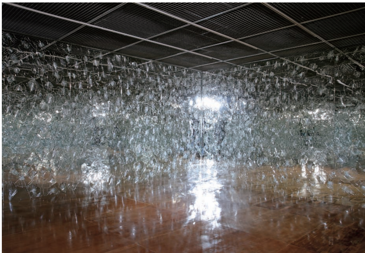
陳松志 無題一房間2 2008 明鏡、木料 780×610×300cm