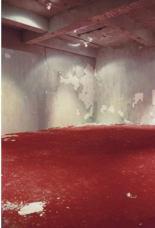
陳松志 記憶·果園 2003 煮、炸、烤成碳的蘋果、氣味、亮光地板 尺寸依空間而定 右·陳松志 矯揉造作 2003 洗衣粉混水泥、地毯 550×500×300cm 圖為新樂園藝術空間展場一景

但談到這件作品，陳松志認為自己在當時仍是試圖以自然反思自然、以物質辨證自身。只是隨著創作的累積與推展，自己也慢慢地想要與作品保持更多的距離，因此後來嘗試以人造或工業素材呈現有機感。當然，對於觀展經驗豐富或熟悉現代美術史的觀眾而言，陳松志一貫低限的語彙與使用現成物（特別是廉價或廢棄的日常用品）的手法，讓人總聯想到極簡主義和義大利的貧窮藝術運動。不過在陳松志的創作中，形式有非常大的比例仍是來自於藝術家本身的個性與氣質，而不是學院訓練的制約。